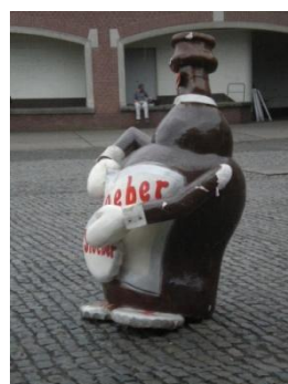
A la brasserie Roman.