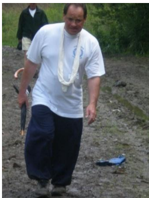
Christian dans la boue.