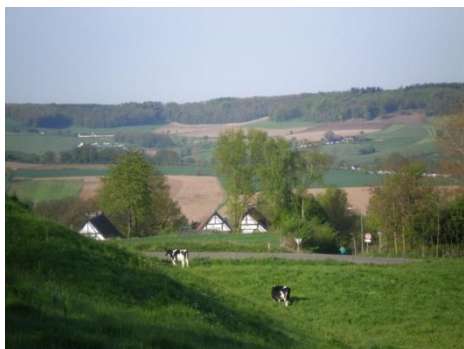
Paysage ouvert typique