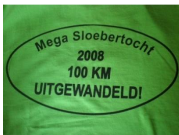
Et le tee-shirt mille fois mérité.