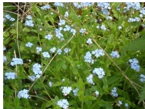
Magnifique tapis de myosotis