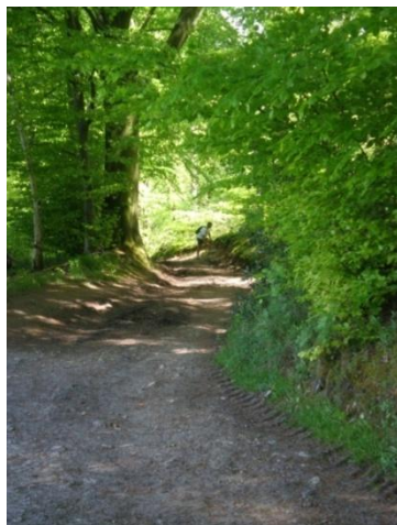
A l'ombre de la forêt