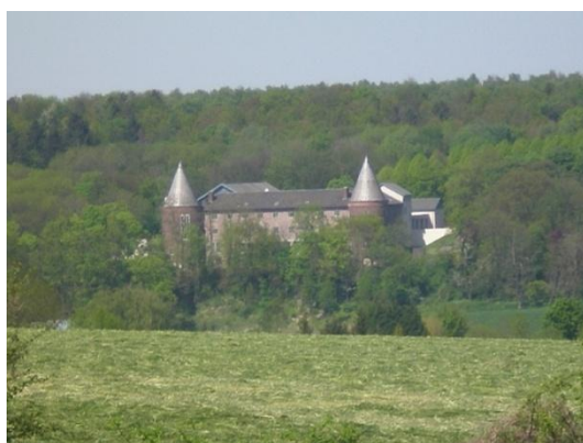
Château de Vijle

J'espère que cet article vous incitera à visiter cette magnifique région et peut-être à y effectuer l'une ou l'autre marche.