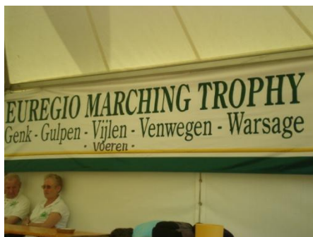
Banderole bien connue du trophée

Les clubs participants sont : pour la province de Liège-Wallonie Les marcheurs de l'Alliance Warsage, pour le Limbourg néerlandais, De Veldlopers GULPEN et JO-NE Vijlen, pour le Limbourg belge, les Berg-& Boswandelaars Voeren et de Heikneuters Genk, et pour l'Allemagne, Touristenverein 1910 Venwegen.