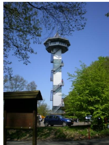
Site des 3 bornes