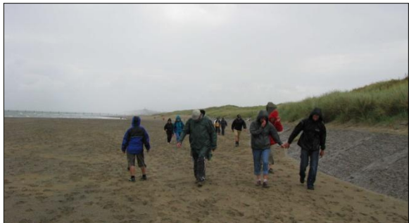
Malgré la pluie,