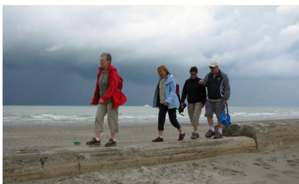
Nous sommes partis d'un pas décidé