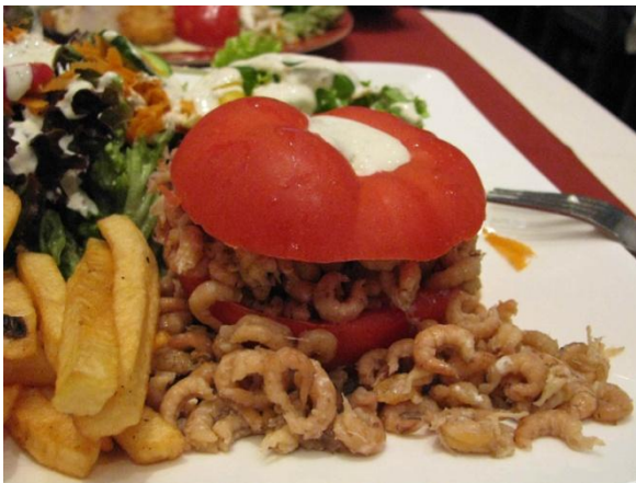
Ou pour les femmes ...