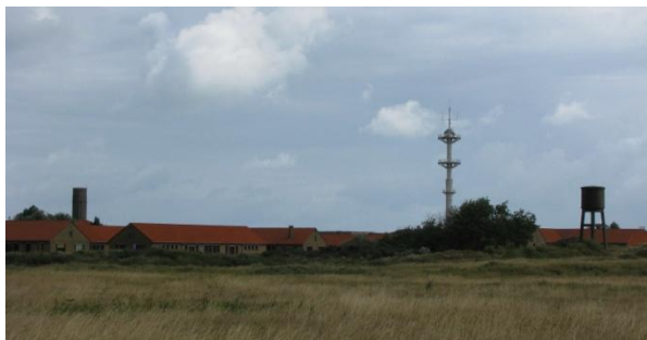
Comme pour le pire des paysages