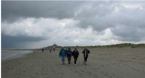
Malgré le vent,