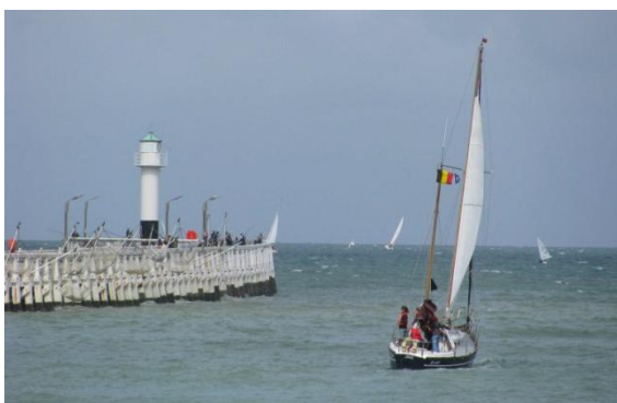
Pour le meilleur