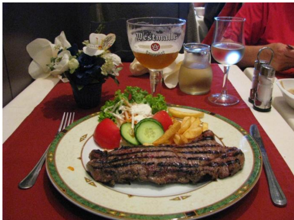
Au passage, un petit réconfort pour les hommes