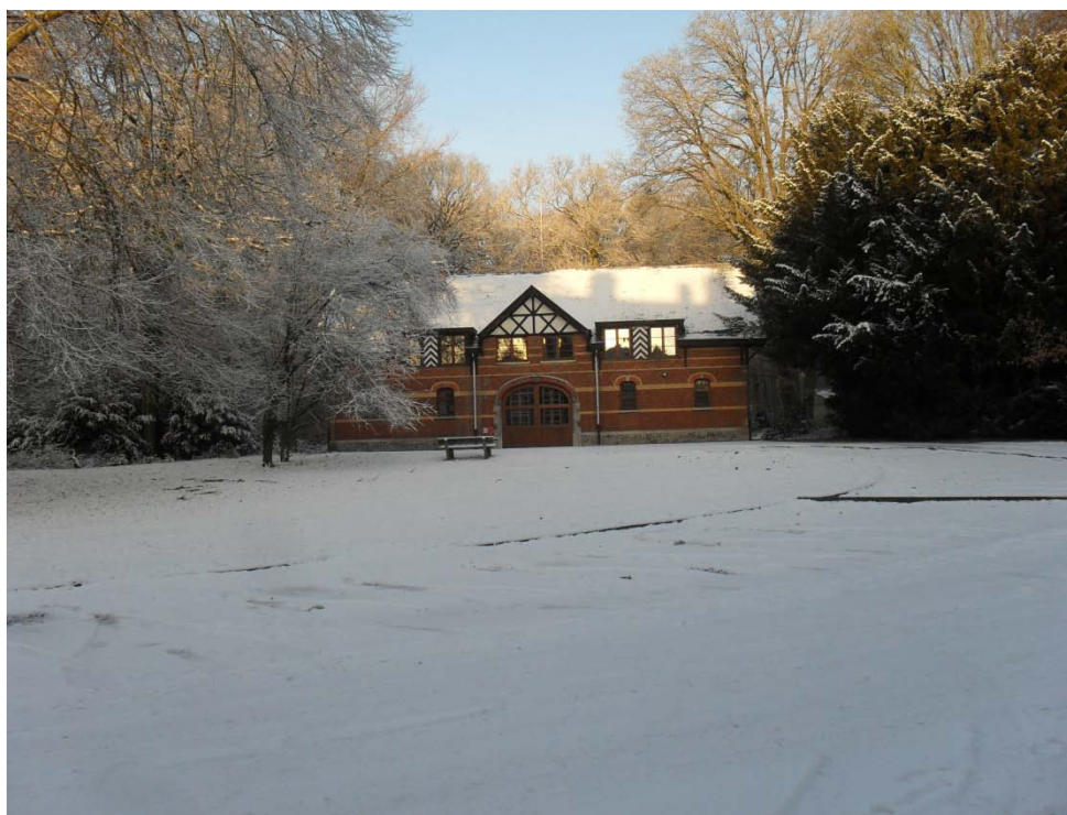
Reconnaissance de la marche de février : le bâtiment de l'ONE