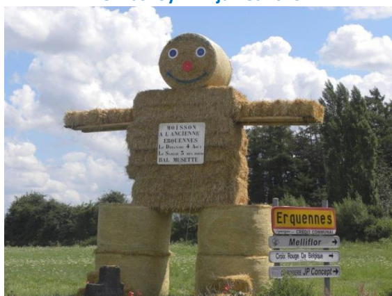
Erquennes – 4 août 2013