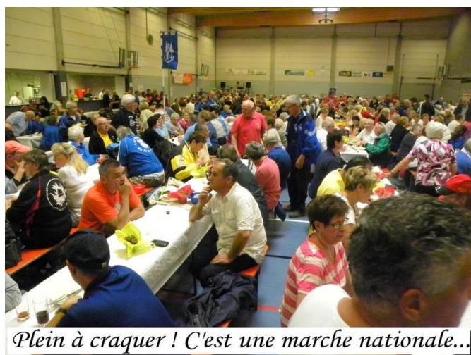
Plein à craquer ! C'est une marche nationale...