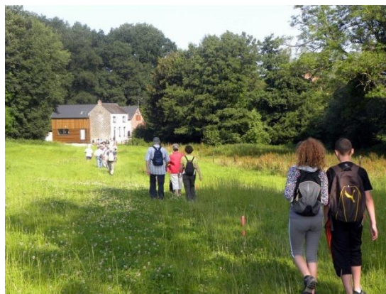
Blaugies – 10 juillet 2013