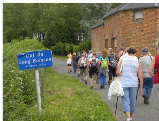
Louvignies 31 juillet 2013