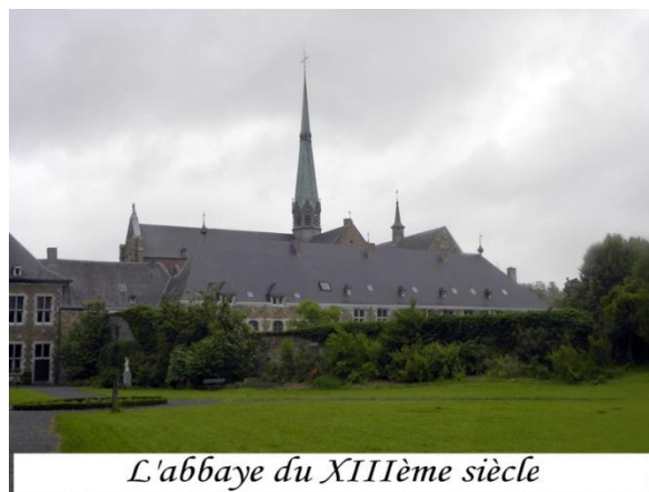
L'abbaye du XIIIème siècle