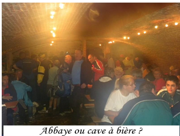
Abbaye ou cave à bière ?