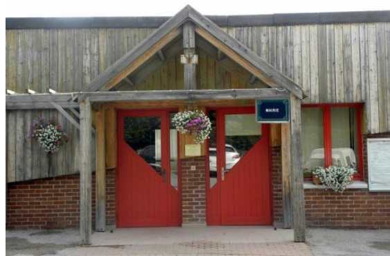
Le Frasnoy – 17 juillet 2013