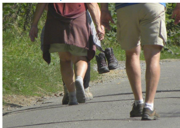
Herbiggnies – 14 août 2013