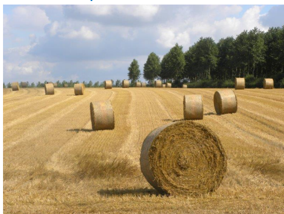
Herbiggnies – 14 août 2013