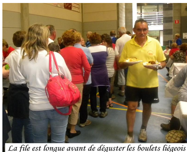
La file est longue avant de déguster les boulets liégeois !

Vous pouvez voir toutes les photos de la journée, elles se trouvent sur le site !