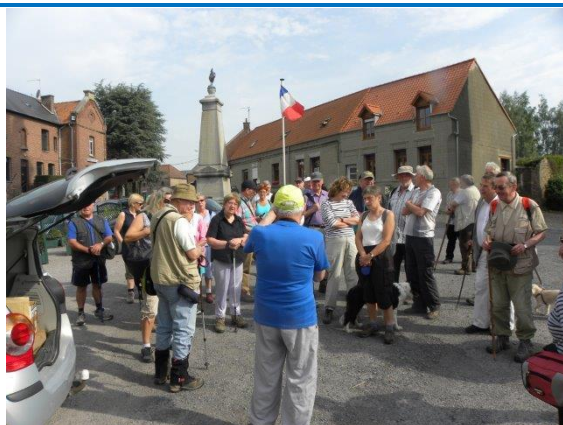
Sebourg – 19 juin 2013