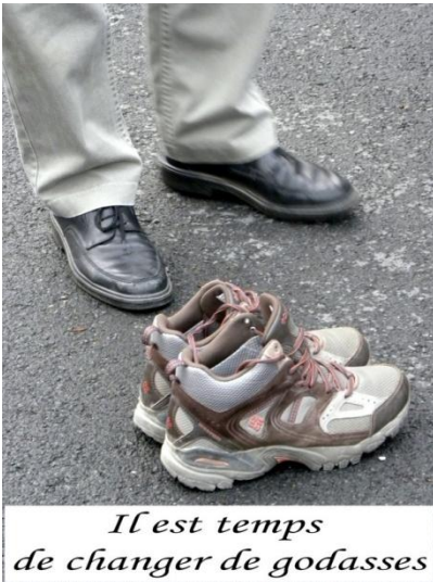
Il est temps de changer de godasses

Nous arrivons à Aubel vers 10 h. Le temps de nous régaler avec une petite gâterie proposée par le club organisateur et ... En route pour 4, 6, 12 ou 21 km.