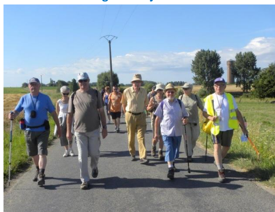
Erquennes – 4 août 2013