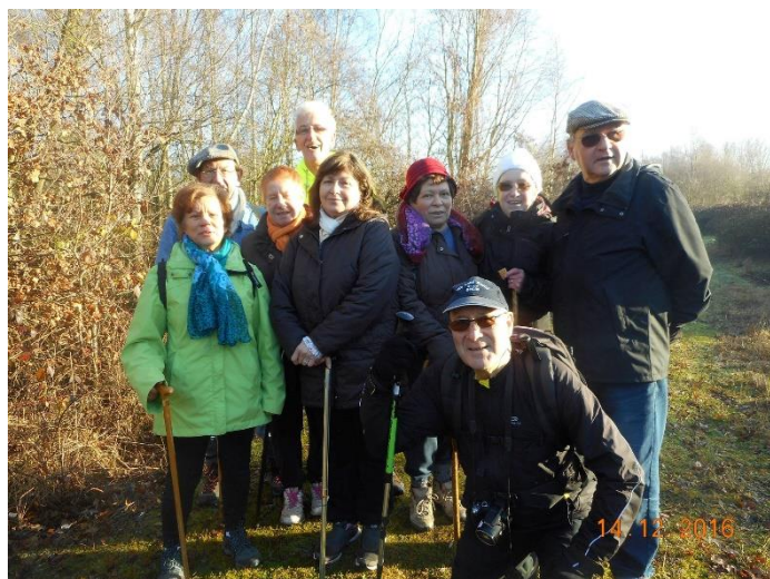
Tertre le 14.12.2016