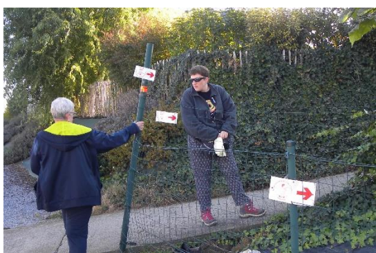
Par monts et par vaux...