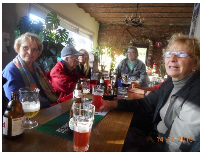
Tertre le 14.12.2016 (après l'effort...)