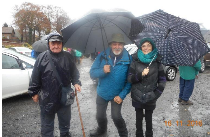
Sebourg le 16.11.2016