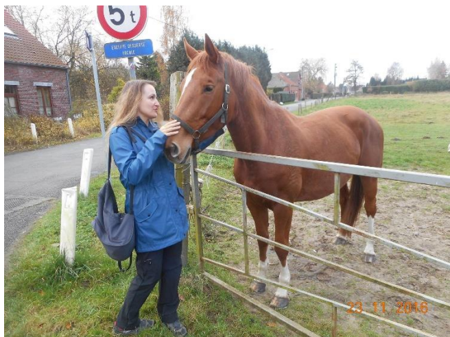
Ghlin le 23.11.2016