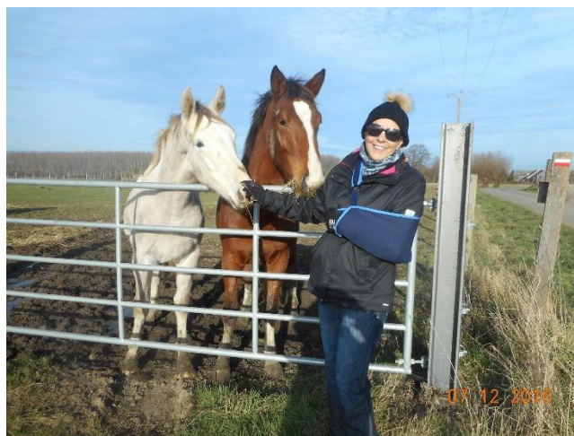
Blaugies le 07.12.2016