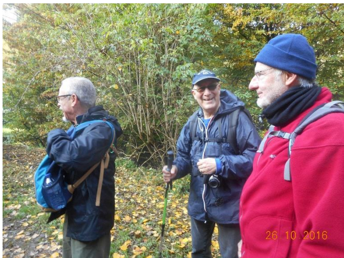
Athis le 26.10.2016