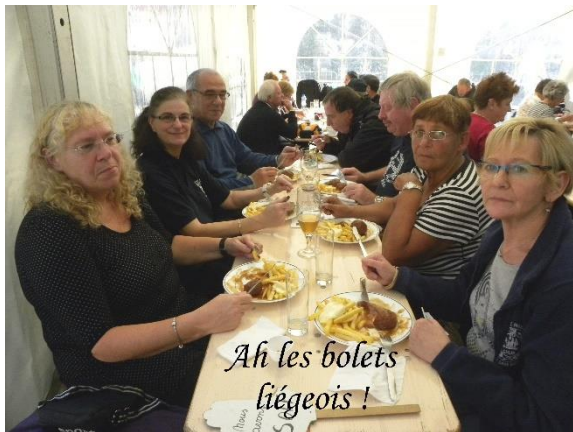
Ah les bolets liégeois !