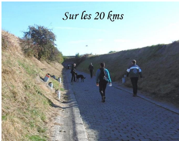
Sur les 20 kms