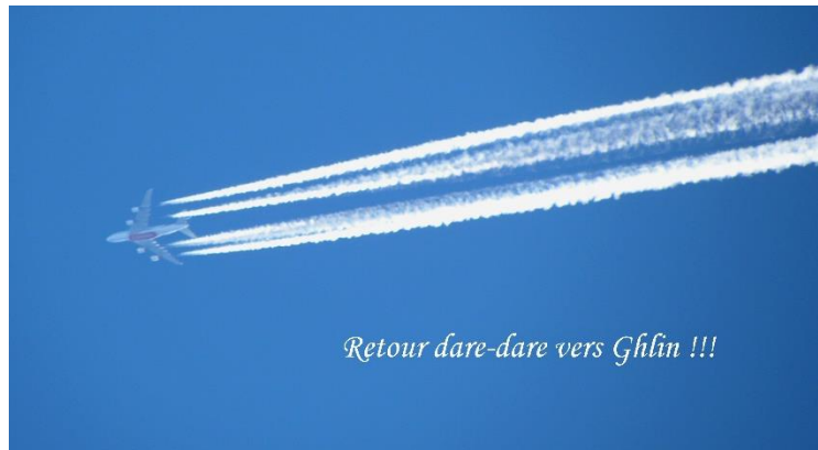
Retour dare-dare vers Ghlin !!!