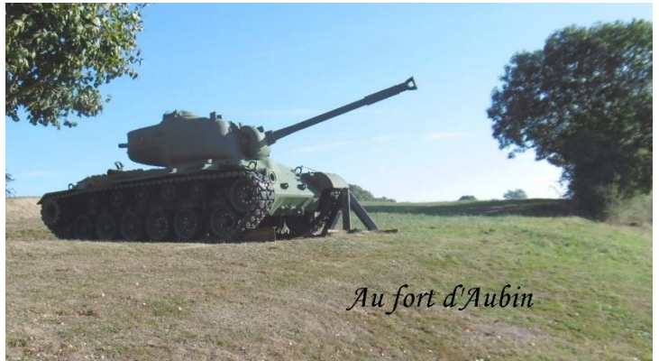
Au fort d'Aubin