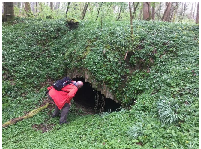
La Cave du R'mite

Niché dans le bois d'Angre à Roisin, le Caillou-qui-Bique attise la curiosité pour plusieurs raisons. La première, c'est son histoire quelque peu rocambolesque. Figurez-vous que la grosse pierre serait l'œuvre du diable. Satan n'aurait pas supporté que saint Remacle construise l'Abbaye de Stavelot. Pour empêcher l'inauguration, il partit des Pyrénées, un énorme rocher sur le dos, dans le but de le lancer sur l'église. Mais en chemin, il rencontra un pauvre homme qui lui dit que la route est encore longue... Découragé et furieux de ne pouvoir arriver à temps pour gâcher les festivités, le diable lâcha par colère son rocher qui s'enfonça dans le sol... Ce rocher, qui semble tenir en équilibre depuis la nuit des temps, serait donc le Caillou-qui-Bique !