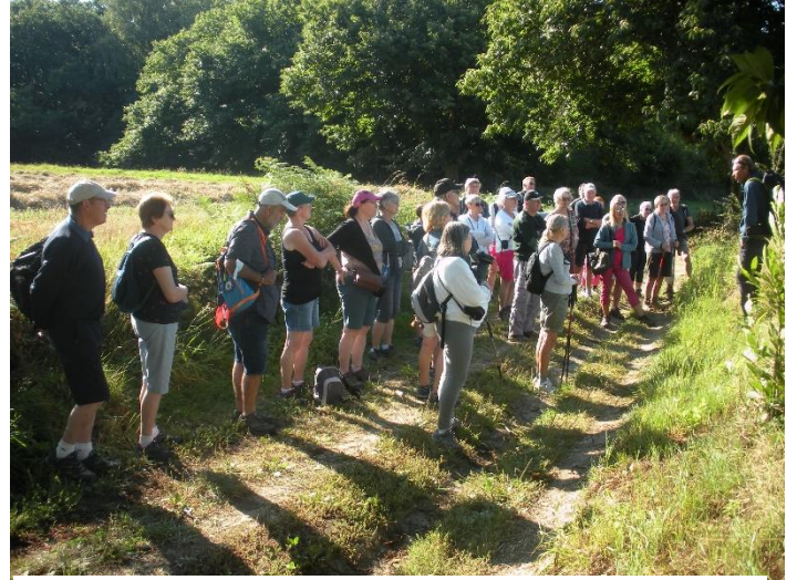
Le groupe des chauffards des cimes

Le programme de ce séjour était composé de randonnées commentées et de visites guidées. Pour ce qui est des randonnées, deux groupes s'étaient constitués en fonction des forces en présence : les Chauffards des Cimes et les Contemplatifs. Les circuits étaient plus ou moins communs, mais plus longs et plus accidentés pour le groupe des Chauffards ☺. Je vous citerai seulement quelques endroits typiques visités : la fontaine miraculeuse (qui avait perdu son caractère miraculeux vu qu'elle était asséchée), les pommeraies, les châtaigneraies, les noyeraies, les viaducs ferroviaires de Vignols, l'ancienne voie romaine de Lémovice et sa forêt maquisarde, la tour d'Yssandon, vestige d'un château médiéval et sa vue imprenable sur près de cinq départements, les gorges du Saillant, le circuit des Grives aux Loups de Perpezac-le-Blanc, qui offre un joli point de vue sur Ayen.