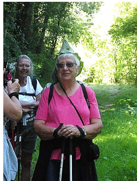
Le chapeau d'Hélène