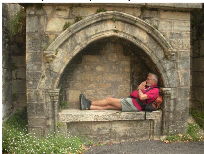
Abribus, rue des Ecoles à Ayen