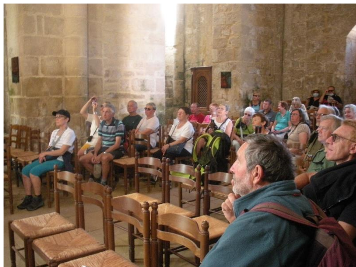
La file d'attente pour le confessionnal ...