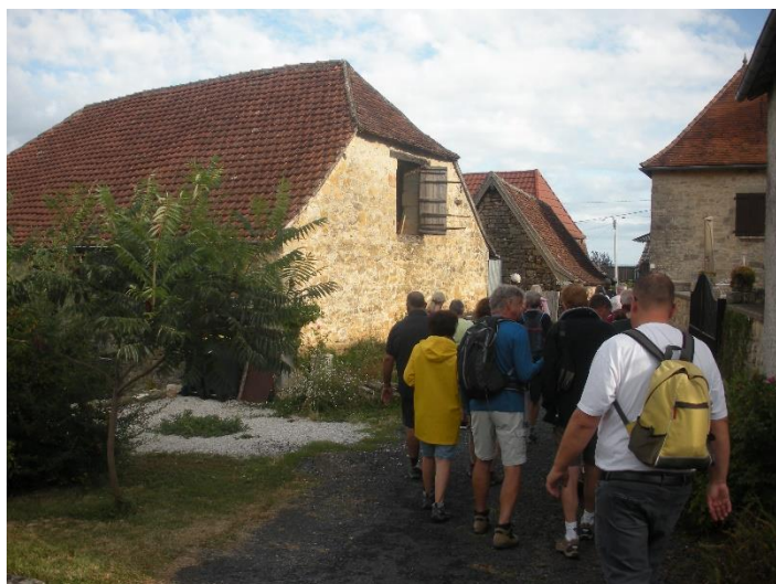
Visite des Pans de Travassac