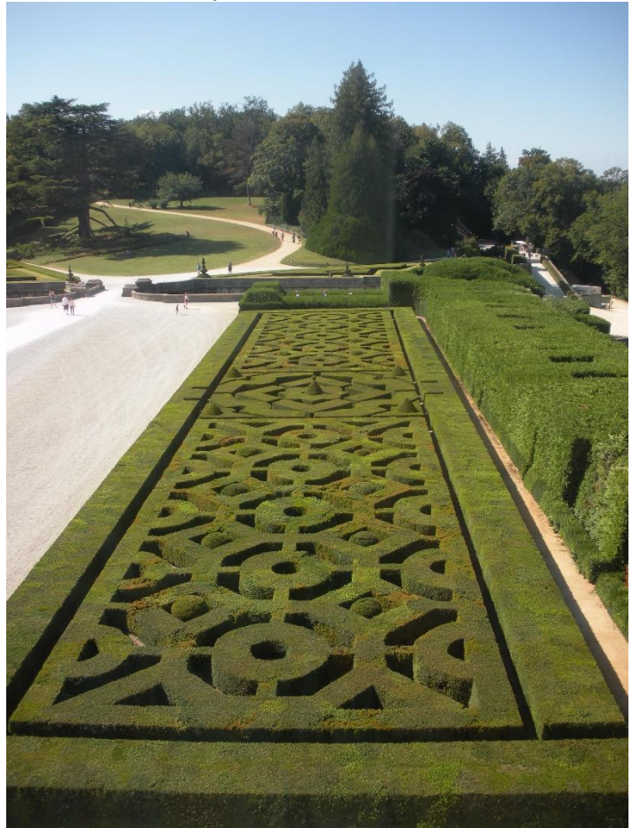
Le château de Hautefort et ses jardins