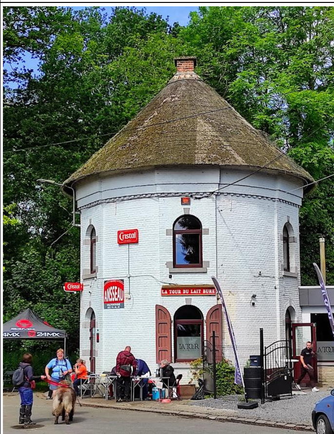
La Tour du Lait Buré