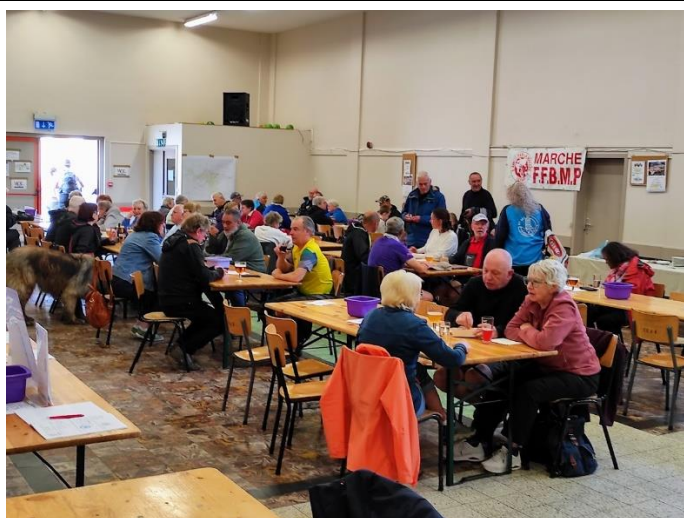
La salle du Foyer Rural